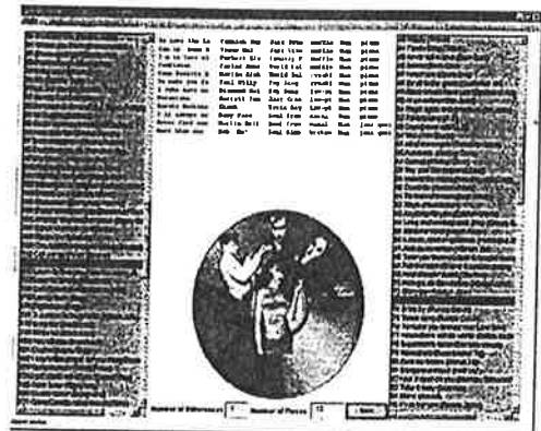
Figure 3. L'interface de PathBuilder . L'utilisateur choisit un morceau de départ et un morceau d'arrivée, ainsi que le degré de "discontinuités". PathBuilder trouve un chemin qui va de l'un à l'autre, à partir des titres du catalogue. Les discontinuités sont indiquées en rouge, les continuités en bleu.

acceptables. Le système résultant, RecitalComposer , permet alors de proposer différents services pour la sélection musicale interactive. L'un d'entre eux, appelé PathBuilder , permet de spécifier un morceau de départ, et un morceau d'arrivée, à partir d'un catalogue de titres. L'utilisateur peut ensuite spécifier la longueur du programme (par exemple 25 morceaux), et le nombre de discontinuités entre 2 titres successifs. Une discontinuité dans ce contexte est une différence de valeur pour un attribut des titres.