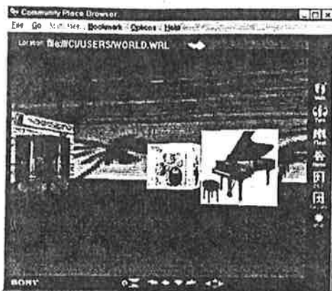
Figure 2. MidiSpace 3D sur un trio de Jazz.

La question principale qui se pose dans un tel environnement est alors celle de la cohérence: comment les déplacements de l'auditeur, et des sources sonores peuvent-ils faire sens ? Comment concilier l'idée même d'une ingénierie du son, avec celle d'un contrôle autorisé par l'auditeur ?